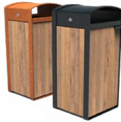
STORR 100L HOLZ