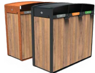
STORR 3 STRÖMUNGEN 70L HOLZ