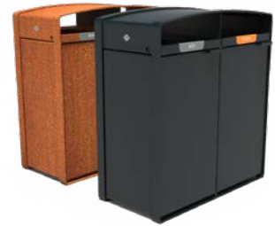
STORR 2 STRÖMUNGEN 100L